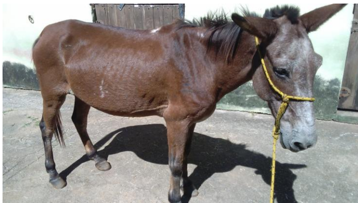
Mula castanha, apreendida em 20/04/19 às 10h40 na Rodovia Felipe Nasser