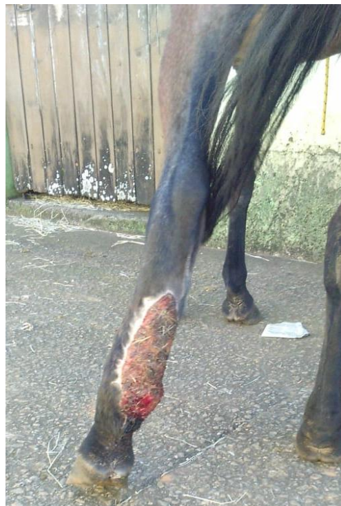
Cavalo castanho, apreendido em 21/04/2019 às 09h25 na BR 491

Obs: O animal apresenta uma lesão no membro posterior esquerdo, causa provável Abronema. Já está devidamente medicado.